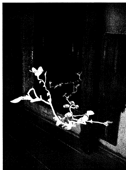
2007年8月から9月に行われた富山県氷見市で行われたサステイナブルアートプロジェクト「ヒミング」での蔵再生プロジェクトの風景。古く使われなくなった港の番屋に九谷焼による草木の連関の作品を展示した。