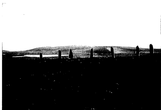
「リング・オブ・ブロードガー」の立石

父と同郷で、19世紀半ばハイランドの土地を奪われてオークニーに渡った漁師の娘、母メアリはゲール語を話し、ときおりゲール語をまじえてスコットランドの民話やバラッドを子供たちに読んで聞かせた。母の話は実際に体験したことなのだが、いつの